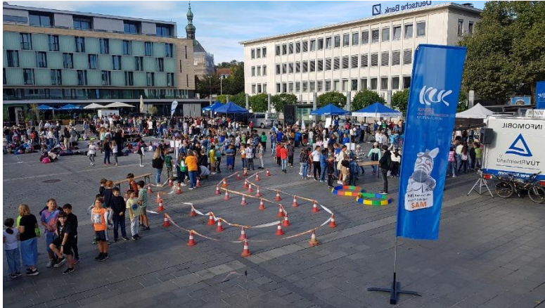
(Tag des Kindes 2023)

Aufgrund von Dauerregen und stürmischem Wetter musste der Tag des Kindes, der am 2024 auf dem Stiftsplatz in Kaiserslautern stattfinden sollte, leider abgesagt werden. Für eine witterungsunabhängige Ausweichmöglichkeit konnte aufgrund der großen Zahl der Kinder und des Platzbedarfs bei schlechtem Wetter bisher keine Räumlichkeit als Alternative gefunden werden.